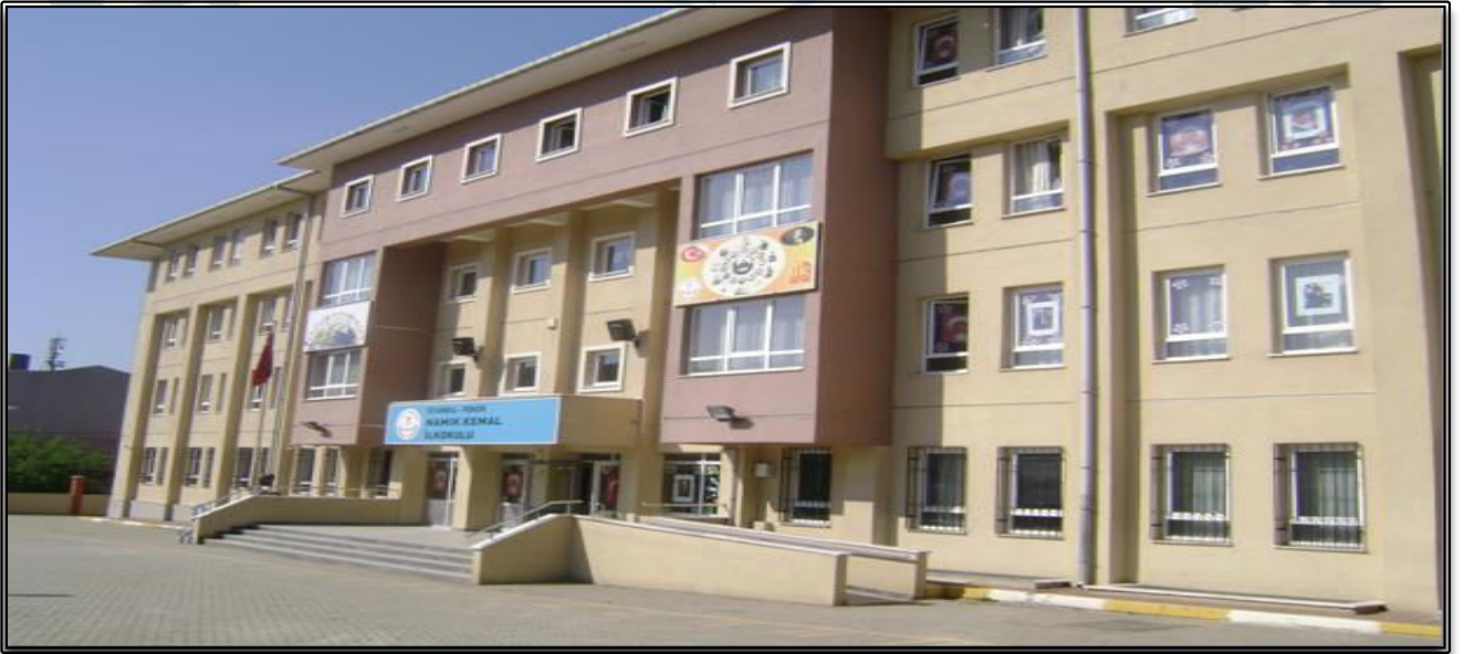
Resim 1: Namık Kemal İlkokulu

Namık Kemal İlkokulu’nda bugün 59 öğretmen, 1219 öğrenci, 24 derslik 48 şube, 2 özel eğitim sınıfı ile eğitim - öğretim faaliyetleri eksiksiz olarak yürütülmektedir. Okulumuzda ikili öğretim yapılmaktadır.